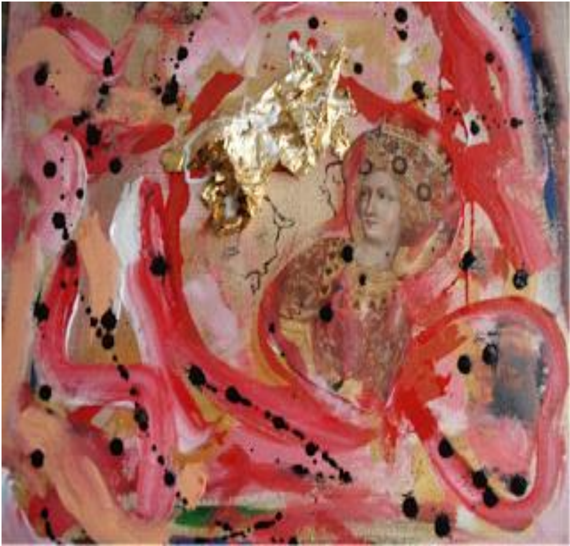
'Sem título' tec mista s tel 50/50 cm 2012

Açúcar Invertido II - Res do Chão in Edson Barrus's loft - Williamburg Brooklyn 71 North Street - Americas Society AS A SATELITE supported by Andy Warhol Foundation for the Visual Arts - New York - EUA. Urban Flesh and Blood - The Kaliningrad Branch of the Arts - Cinema Barricades, Kaliningrad, Russia. Filme feito com colaboração da CET Rio. Caotic Traffic in Brazil. Branco do Olho - Salinha de Arte de Recife. Galeria La Pigna pertencente ao Vaticano. Patrocínio Polaroid para varias exposições. Escreveu e ilustrou o livro de contos "O Rabino e o Psicanalista", Ed.Taurus,1984 e em 2012 publica a 4.Ed pela KBR com tradução para inglês sendo este comercializado pela Amazon. Atuou como fotógrafa de shows de musica instrumental no Jazzmania/RJ, criou uma escultura em areia para a capa do CD "Ruínas da Babilônia", da Tribo de Jah.