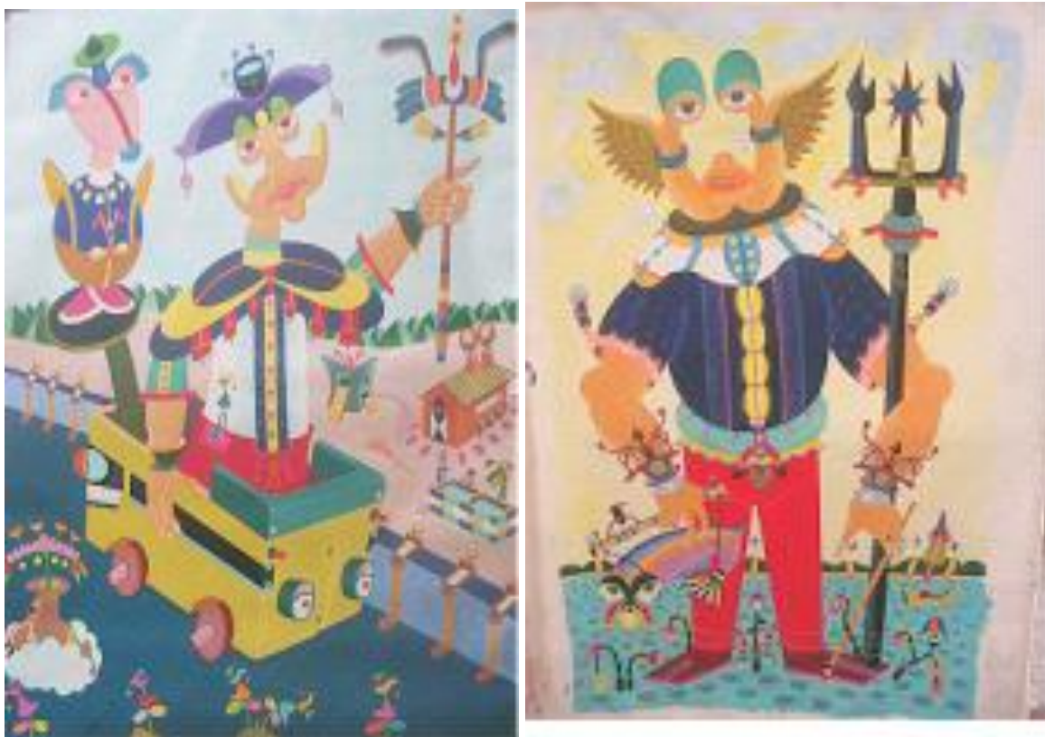
‘Corrida com carrinho de rolimã e Poisedon’ Pintura com tinta acrílico sobre tela 100 X 87cm, 150 X 120cm e 194 X 135cm. 2013

Na minha visão, o artista não precisa ser considerado apenas como representante de uma cultura, ou de um período, isto porque com meu trabalho almejo representar a humanidade. Minha arte não precisa ser realista nem ter uma classificação definida, mas ela precisa realizar desejos, abrir caminhos para a fantasia, extasiar, chamar para brincar, abrir sorrisos, expressando também meu lado lúdico.