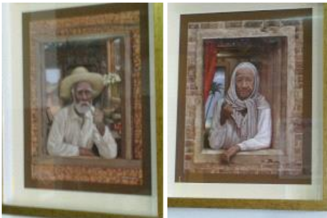
Título: Preta e preto velho Dimensão: 30x40cm cada Técnica: Imagem 3D, recorte de gravuras sobrepostas. Ano: 2013

Assistente Social, graduada pela Universidade Católica do Salvador, pós-graduada em Gestão Social pela Unijorge e Especialista em Consciência e Educação pelo ISEO. Estudante de Direito pela Faculdade Mauricio de Nassau