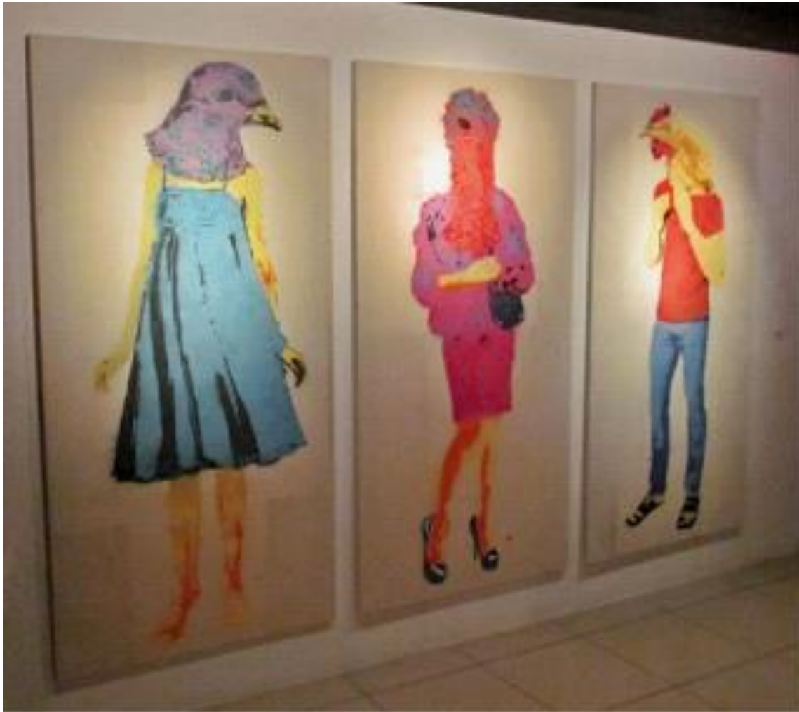
Três telas de tecido cru trabalhadas em stencil + Instalação sonora

2012- Artes Visuais. Universidade Federal do Vale do Rio São Francisco , UNIVASF.