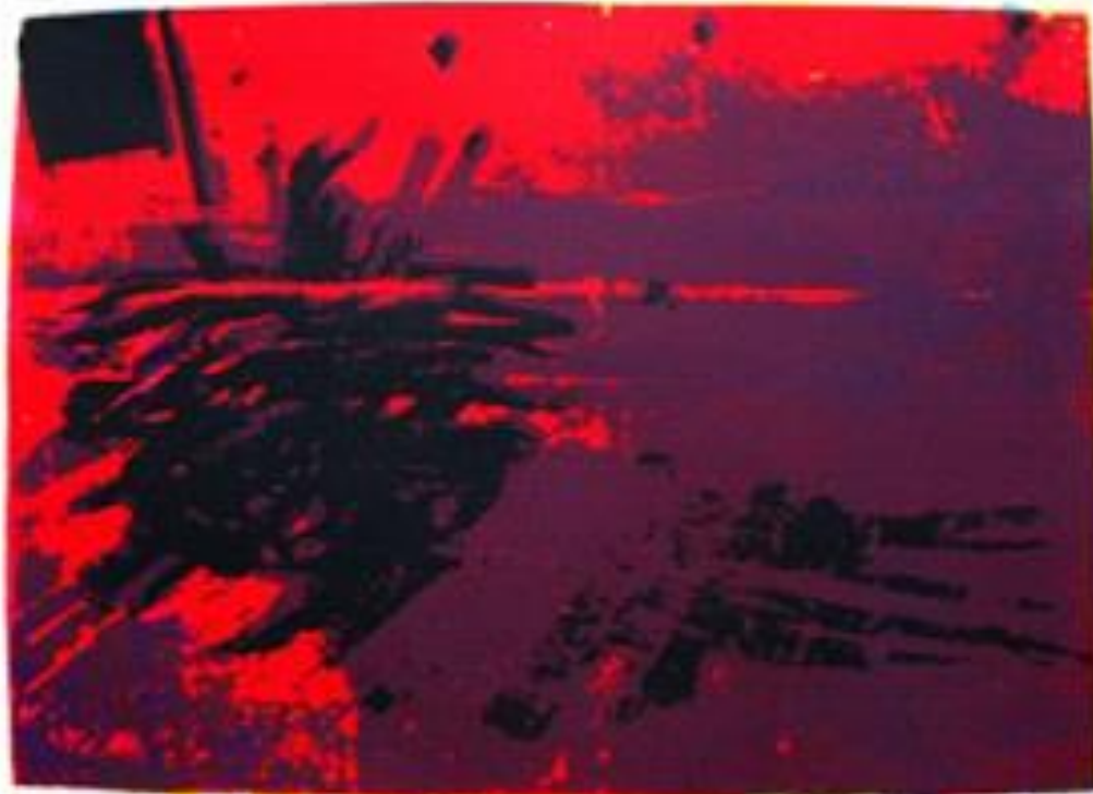
'Acenda ' Serigrafia 2012

Natural de São Caetano do Sul 1977, São Paulo. Formado em Artes Plásticas em 2007 pela UFBA.