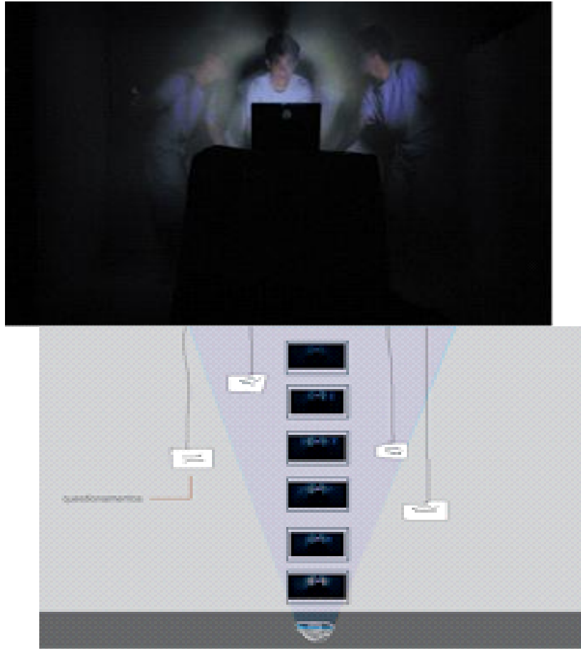
"nosce te ipsum" Fotografias 2013

Exposição fotográfica "Fotografia & Pintura: Diálogos Possíveis", 2013, na UFRBe Federal Centro de Cultura Maria Milza, em Cruz das Almas. Parque do Saber, em Feira de Santana. Mostra coletiva "Entre Relevos" - 2013, na UFRB. Exposição fotográfica "Fronteiras da Memória", 2013, na galeria do Identidade Brasil, em Cachoeira ".