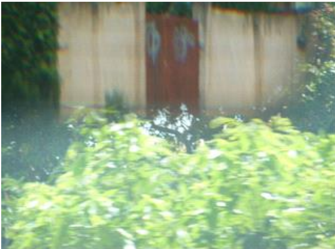
Categoria: Fotografia Título: S/ título, série “o melhor instante do presente” Material: Fotografia Dimensão: 60 x 80 cm

Escultura pela Universidade Federal do Rio de Janeiro (2012).