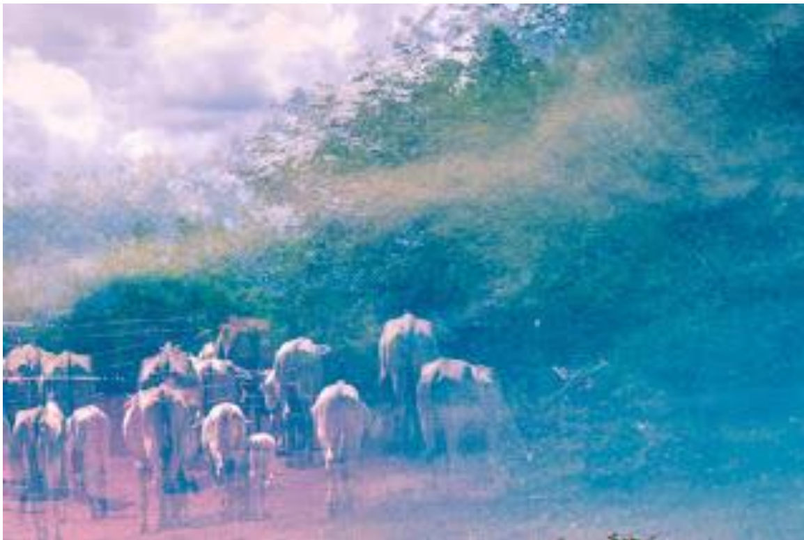
"A Morte dos Bois"