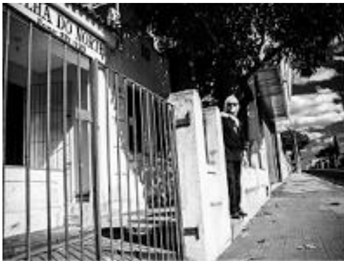
'ensimesmos' Fotografias 4 10x15 emolduradas

Graduado em Comunicação, com habilitação em Jornalismo pela UFBA.