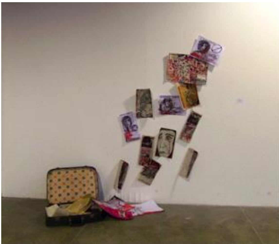
'A Mala de imagens distorcidas' técnica mista

mala e 19 desenhos em tecnica mista sobre papel e jornal