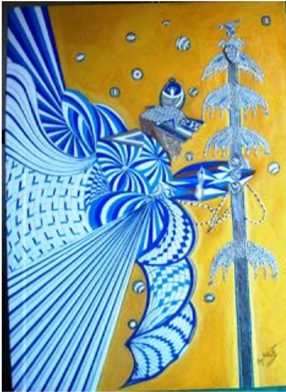
Dimensão: 1,20x80 Técnica: Bico de pena s/ tela e tinta acrílica