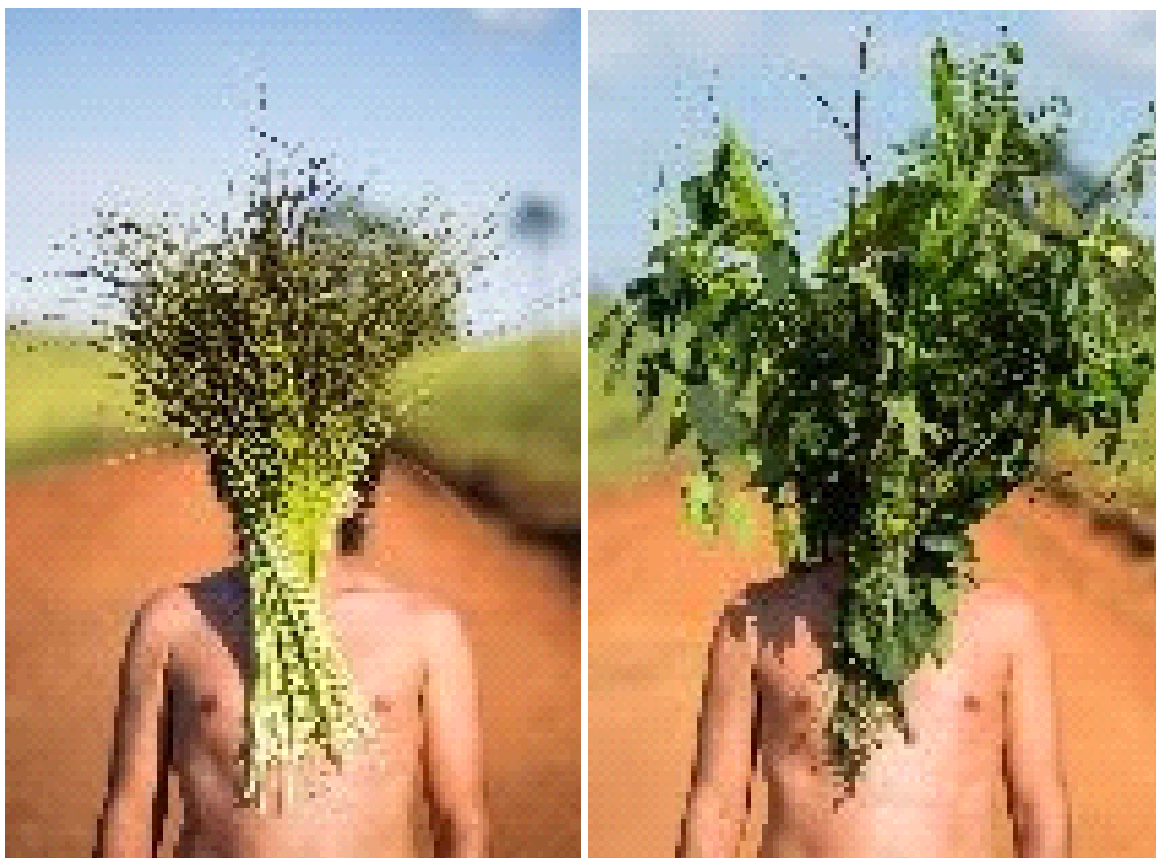
‘Campo Limpo. Campo sujo’ Fotografia 2013

Natural de Belo Horizonte - MG. Artista visual. Possui mestrado em Artes pela UFMG (2008) - Artista residente no projeto “Topografia Aérea: uma fabula sobre poleiros e artistas”. REDE FUNARTE Artes Visuais, abril 2013 - Artista convidado para Mostra de Artes do SESC SP 2010 com exposição realizada no SESC Pompéia - Prêmio no Projeto Arte Urbana Móvel 2010, Uberlândia - Menção Honrosa no 1º Prêmio Arte Contemporânea 2011, Londrina – PR - Convidado para mostra “6B Desenho Contemporâneo Brasileiro”, Centro Cultural Justiça Federal, no Rio de Janeiro. 2012 - Exposição A CIDADE É O LUGAR. Artista convidado. Museu de Arte Contemporânea – MAC Goiás. Goiânia, set. 2012 - Participação no 9º Salão de Artes do SESC Amapá. Macapá – AM, nov. 2012 - ROÇADEIRA: encontros de performance em lugares prováveis no Ateliê Labiríntimos - Goiânia. 2012 - XXI Bienal do RECONCAVO. Artista Selecionado. São Felix, BA Centro Cultural Dannemann, nov. 2012 - 43º SALÃO DE ARTE CONTEMPORANEA DE PIRACICABA - Selecionado com instalação “Ruínas circulares”. Pinacoteca Mun. Miguel Dutra. Piracicaba, 2011 - 36º SARP- SALÃO DE ARTE CONTEMPORANEA RIBEIRAO PRETO.