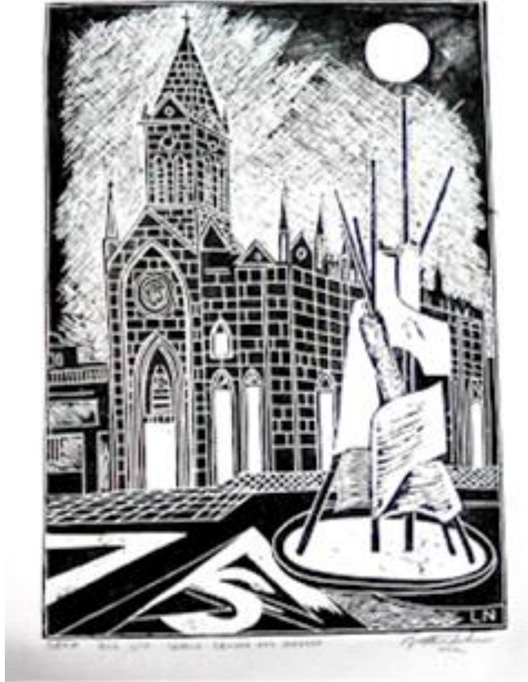
Xilogravura Igreja Senhor dos Passos 50x80 2013