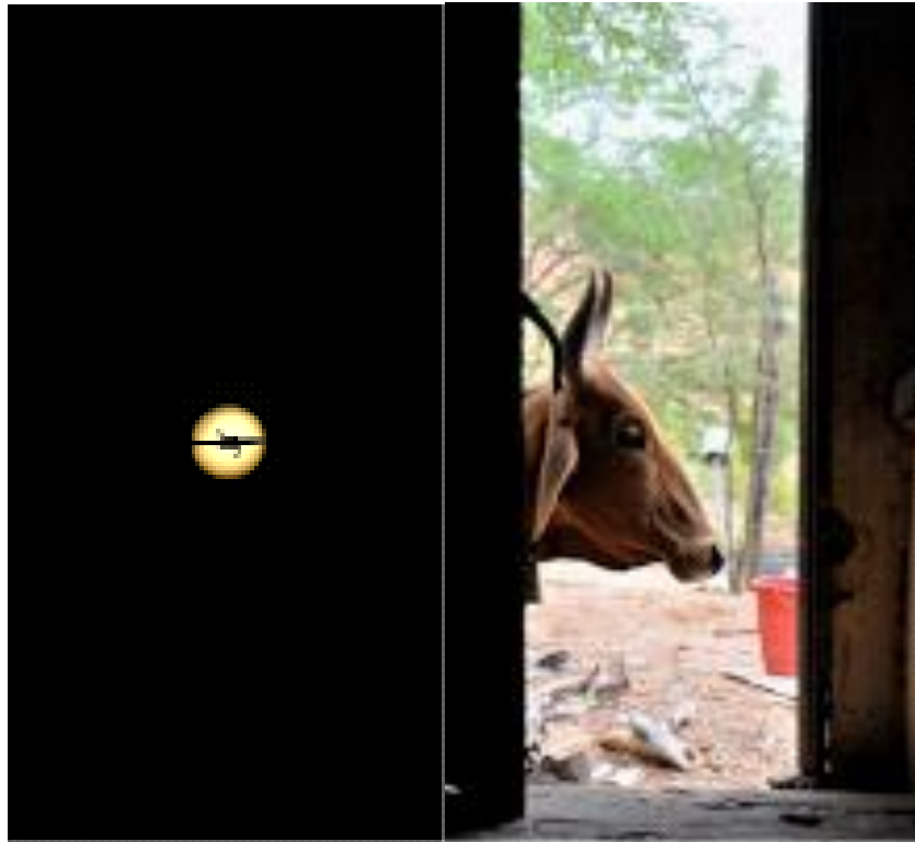
Duas fotografias 25x 40 cada 2013