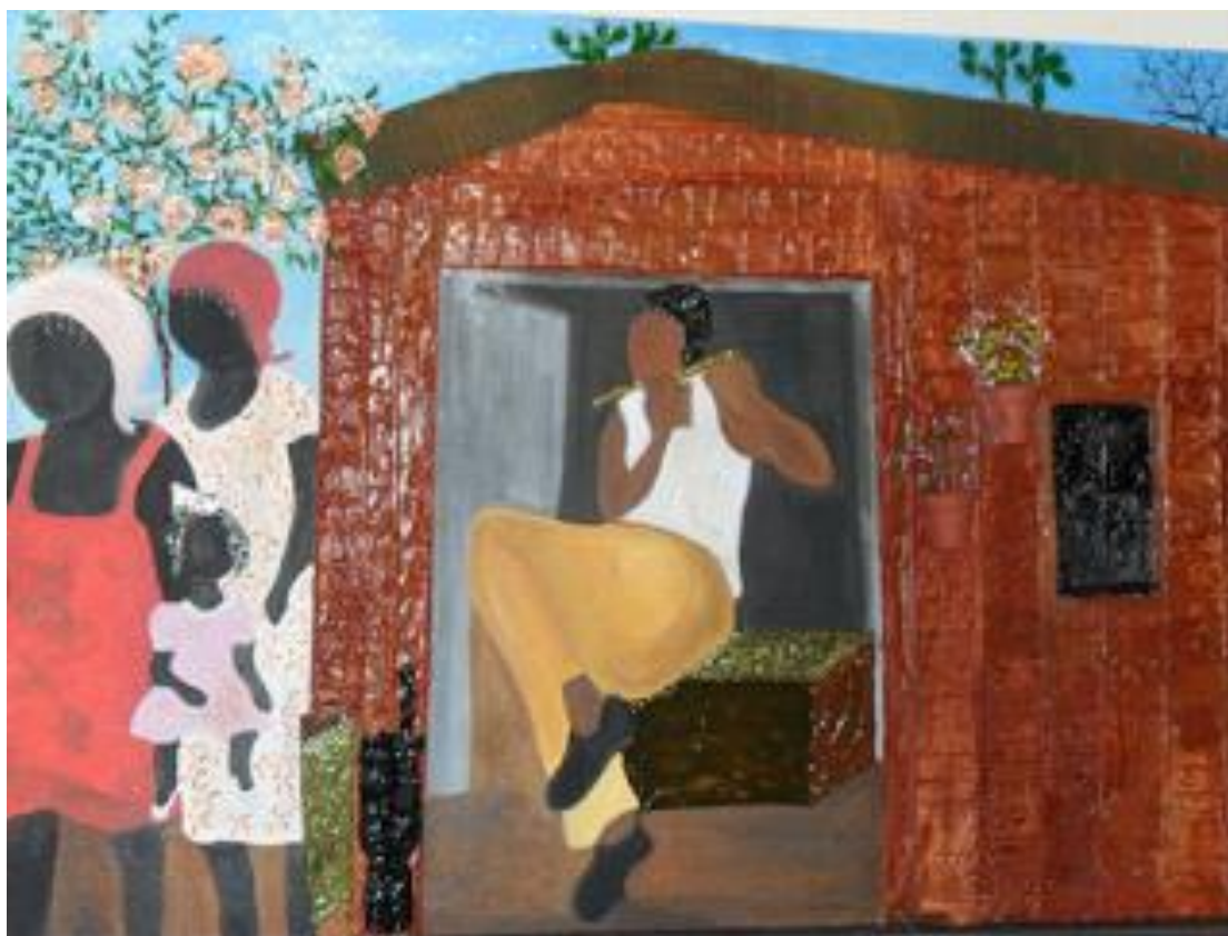
'Mulheres do sertão'