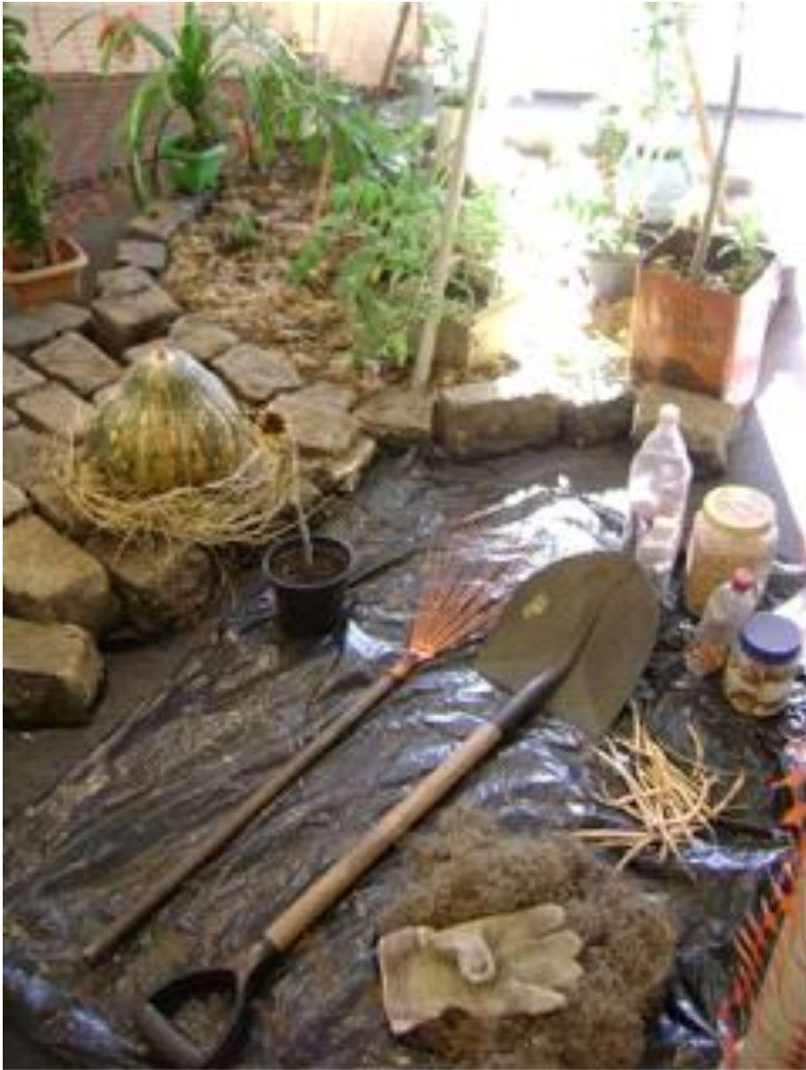
Título: Arte Pública - Escultura_Abrigo 9 fotografias Tamanhos diversos