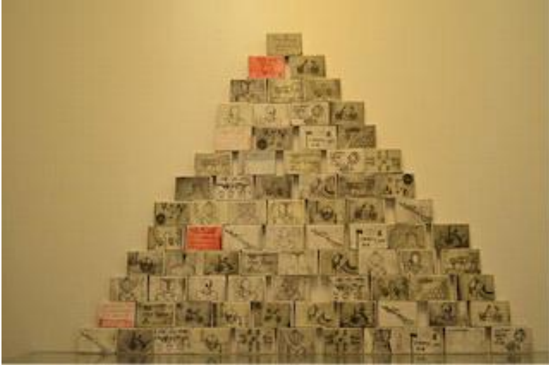
Gravura (Engraving) InBox Project