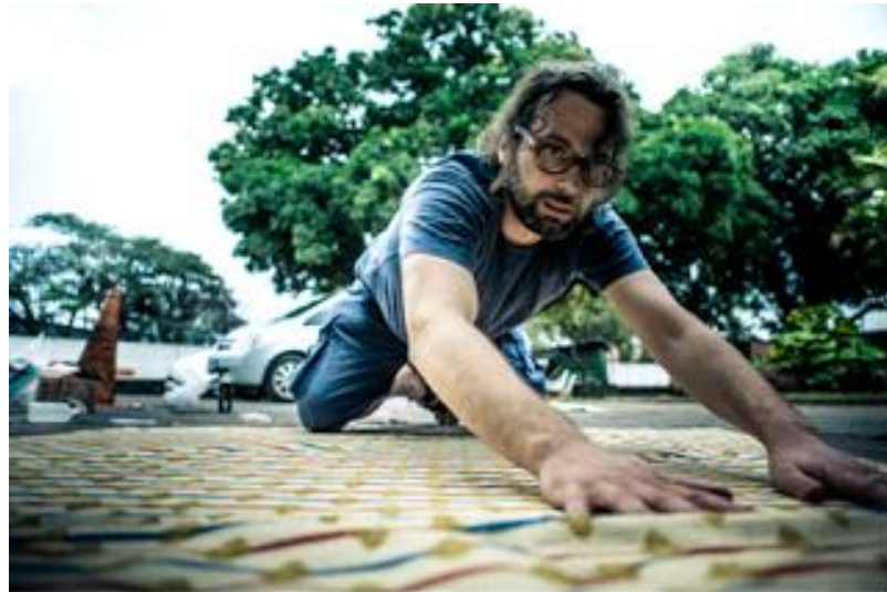
'Arte no espaço público x arte como espaço público em Feira de Santana' 2013

Mestrado em Arquitetura e Urbanismo. Universidade Federal da Bahia, UFBA Graduação em Sociologia. Università degli Studi di Trento, UNITIN, Trento, Itália Salões de Arte da Bahia, edição 2013 Tra il pubblico e il sacro nella Serenissima Museu Diocesano - Sala Sant'Apollonia, Venezia, Itália. 14 a 24 de setembro de 2012 Sob os pés da Itália: nova arqueologia da cultura urbana material Museu de Geologia da Bahia (Salvador, Ba) 2012. MOSTRAS COLETIVAS COM CURADORIA PRÓPRIA Svelare Identità. Fondazione di Partecipazione dell'Ospitalità. Venezia, Itália. 2013. Salões de Arte Visuais da Bahia 2012. Col-letivo II. Associazione Spiazzi (Venezia-Itália)